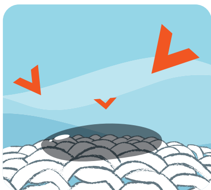
Enzymy pôsobia na škvŕny

Vysoko účinné zložky, ktoré zabezpečia výnimočné odstraňovanie škvŕn a čistenie tých najodolnejších škvŕn po profesionálnom použití.