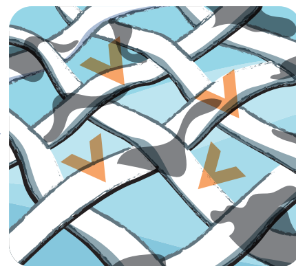
Čiastočky sa ľahšie odstránia pomocou iných zložiek